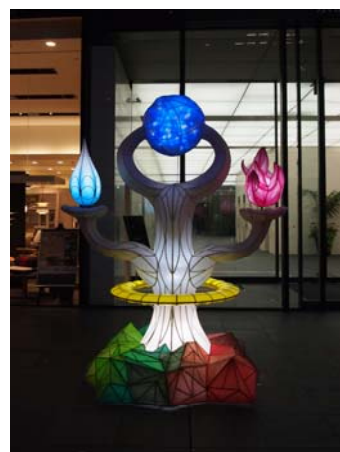
『御堂筋イルミネーション』写真撮影スポット (於：京阪神御堂筋ビル 西側玄関前広場)